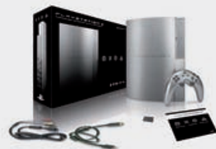
Una Play Station 3